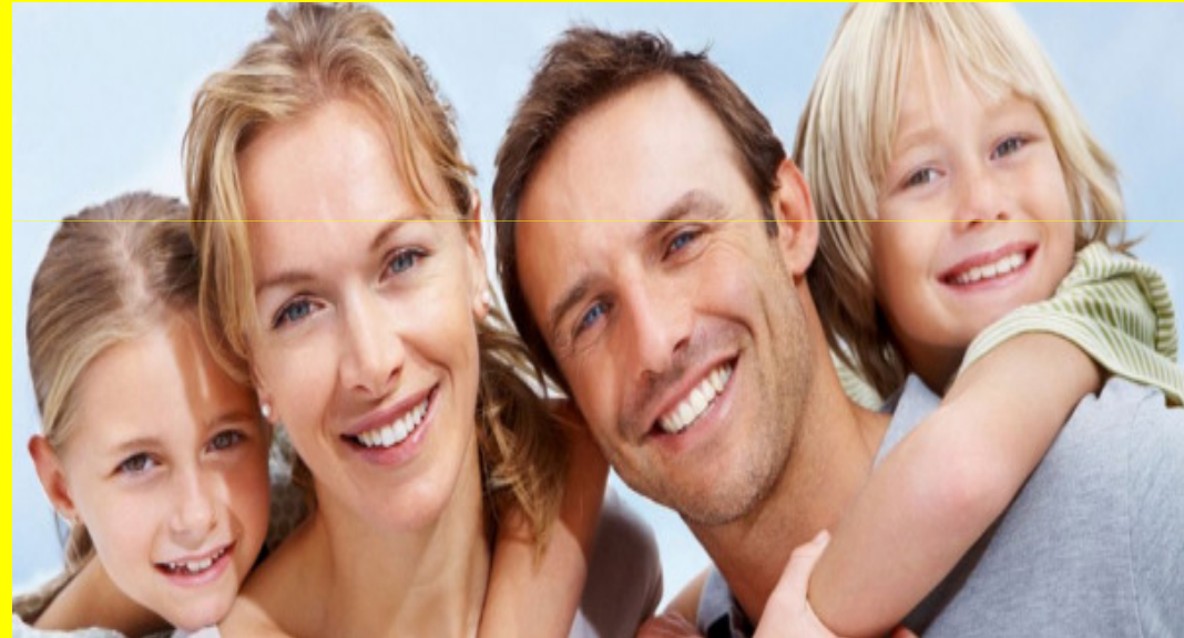
Familienversicherung oder Konkubinats-Paare